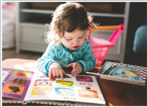
Un guide d'utilisation est disponible.

La trousse contient des moyens concrets et amusants pour développer :